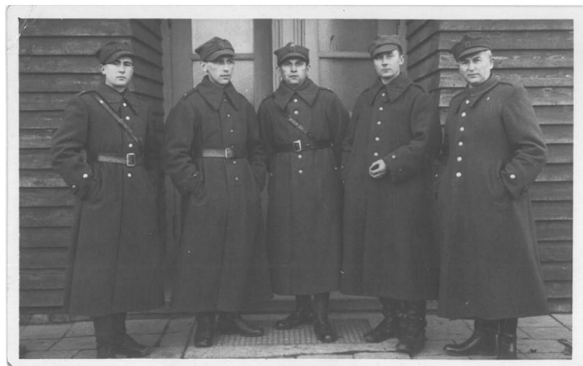
Oficerowie obozu Oflag XVIII C Spittal