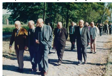
Na Zjeździe Woldenberczyków, Dobiegniew 1991

Zmarł w dniu 4.08.1998 r., w 84-tym r. ż.