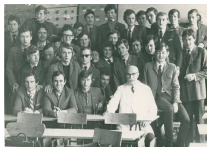
Z maturzystami Technikum Samochodowego Wrocław, maj 1972