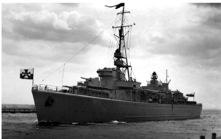
Zbudowany w latach 1934–1938 we Francji, stawiacz min ORP „Gryf” miał 103 metry długości oraz 13 metrów szerokości. Jego załoga wynosiła 188 osób, w tym 12 oficerów. W służbie od 27 lutego 1938 r. karierę miał krótką, został zatopiony 3 września 1939 r.

Od 1 lutego do 1 maja 1937 r. był delegowany do kadry floty jako dowódca plutonu rekruckiego marynarzy. Następnie został oddelegowany na ORP „Mewa” jako oficer wachtowy, po czym został przeokrętowany na nowo zbudowany ORP „Gryf” na funkcji oficera wachtowego. Krótko po tym wyznaczono go na Kurs Oficerów Broni Podwodnej w Gdyni, który trwał od 14 października 1938 do 4 kwietnia 1939 r. Po ukończeniu tego kursu był uznawany za specjalistę broni podwodnej. Wówczas wrócił na ORP „Gryf”, ale już na funkcję II oficera broni podwodnej i służył na nim aż do chwili jego zatopienia, 3 września 1939 r.