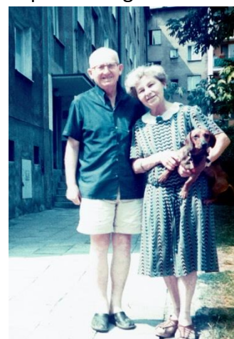
Z Żoną, dzień przed nagłą śmiercią - 15 sierpnia 1995